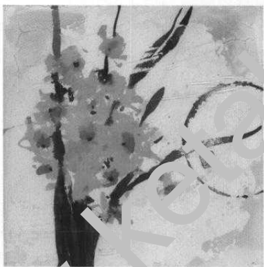
اثر احمد مقتدی | by Ah mad M qta dsi