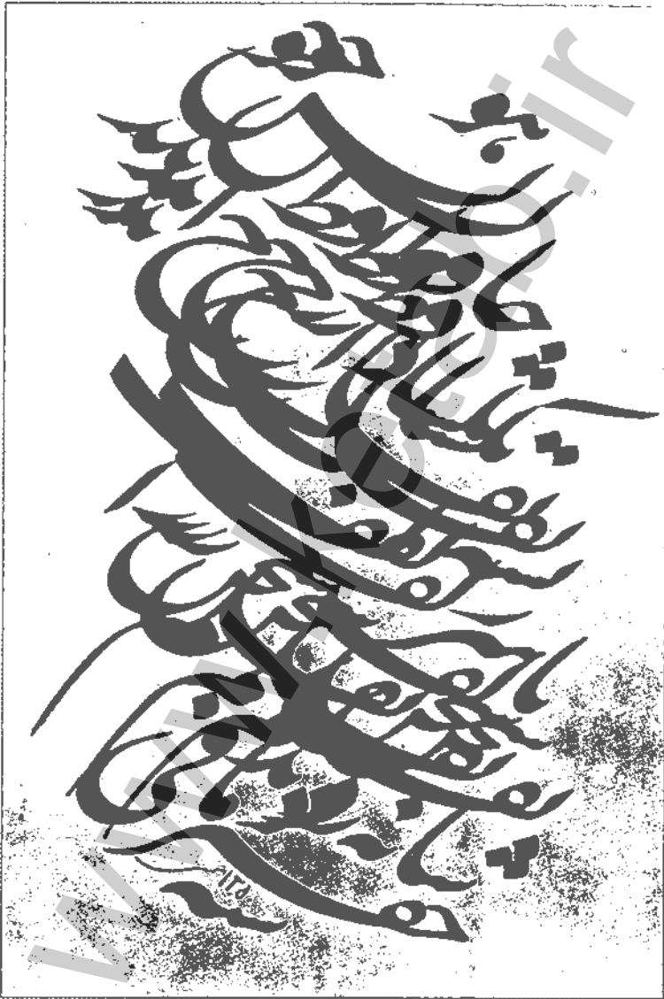
۲. نمونه خط رضا مافی